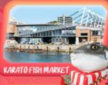
KARATO FISH MARKET