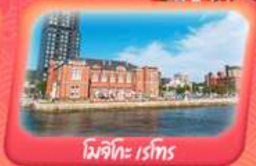
มิจิโกะ เรโทร